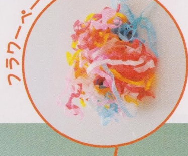
フラワーペーパー