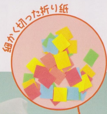
細かく切った折り紙